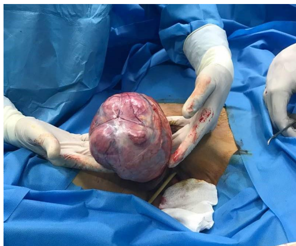
شکل ۱: مراحل عمل