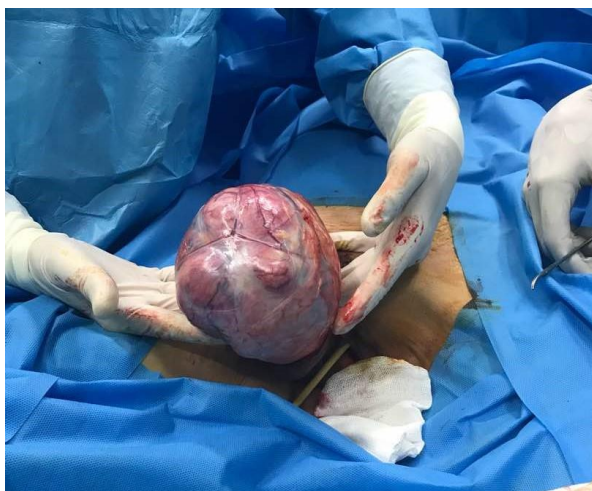
شکل ۱: مراحل عمل