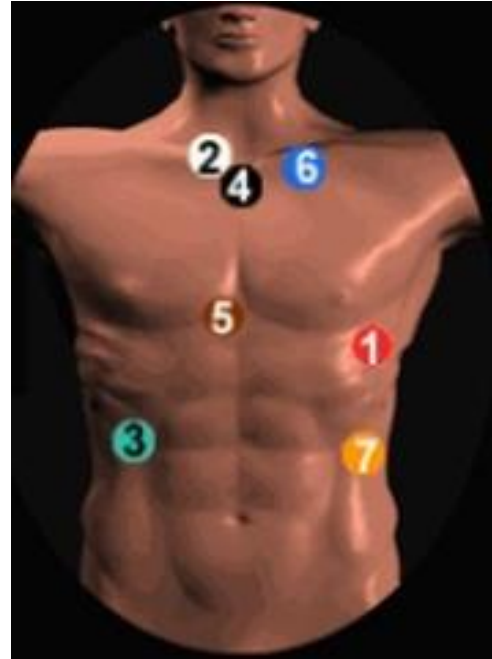
شکل ۱: محل اتصال لیدهای هولتر مانیتور قلبی

کاربرد کلینیکی تغییرپذیری ضربان قلب به عنوان فاکتور پایشی برای اختلالات کشنده و مرگ ناگهانی در وضعیت نارسایی قلبی مزمن است (۴). تغییرپذیری ضربان قلب کاربرد ورزشی دیگری نیز دارد که به عنوان یک شاخص خطر، بعد از دوره بیش تمرینی شناخته می‌شود (۵). افراد شرکت کننده در فعالیت ورزشی که به عنوان افراد فعال شناخته می‌شوند، ضمن اجرای فعالیت ورزشی، به میزان اثرگذاری فعالیت ورزشی اجرا شده بر سیستم‌های مختلف بدن اهمیت فراوانی می‌دهند. افراد عادی جامعه در دوره اجرای فعالیت‌های ورزشی، کم‌تر به اثرات فعالیت ورزشی بر سیستم قلبی عروقی توجه می‌نمایند. درحالی که تسهیل درک بهتر از این اثرات توسط متخصصین علوم ورزشی فواید بی‌شماری برای سلامتی عمومی خواهد داشت.