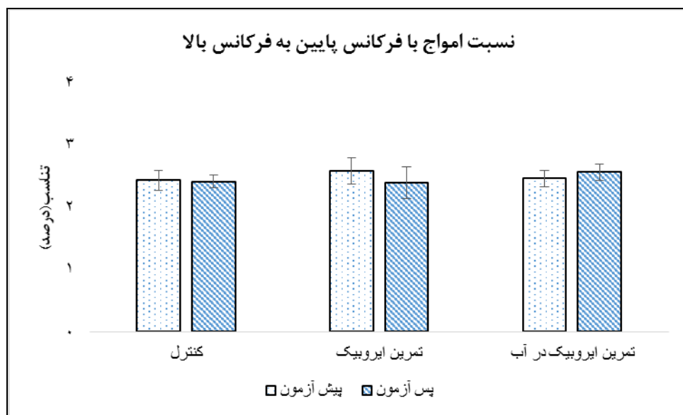
شکل ۴: مقایسه نسبت امواج با فرکانس پایین به امواج با فرکانس بالا (LF/HF) در گروه‌های مختلف پژوهش

و F=9/34 pNN50 ( p=0/01 با اندازه تأثیر 0/28 )، F=12/58 rMSSD ( p=0/01 با اندازه تأثیر 0/34 ) و و p=0/01 با اندازه تأثیر 0/25 ) گردید.