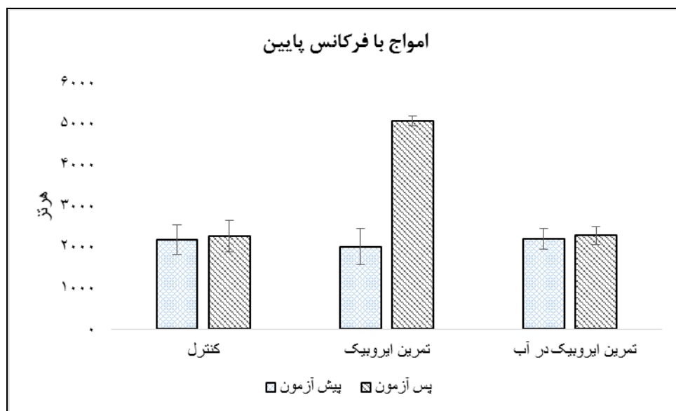
شکل ۳: مقایسه امواج با فرکانس پایین (LF) در گروه‌های مختلف پژوهش